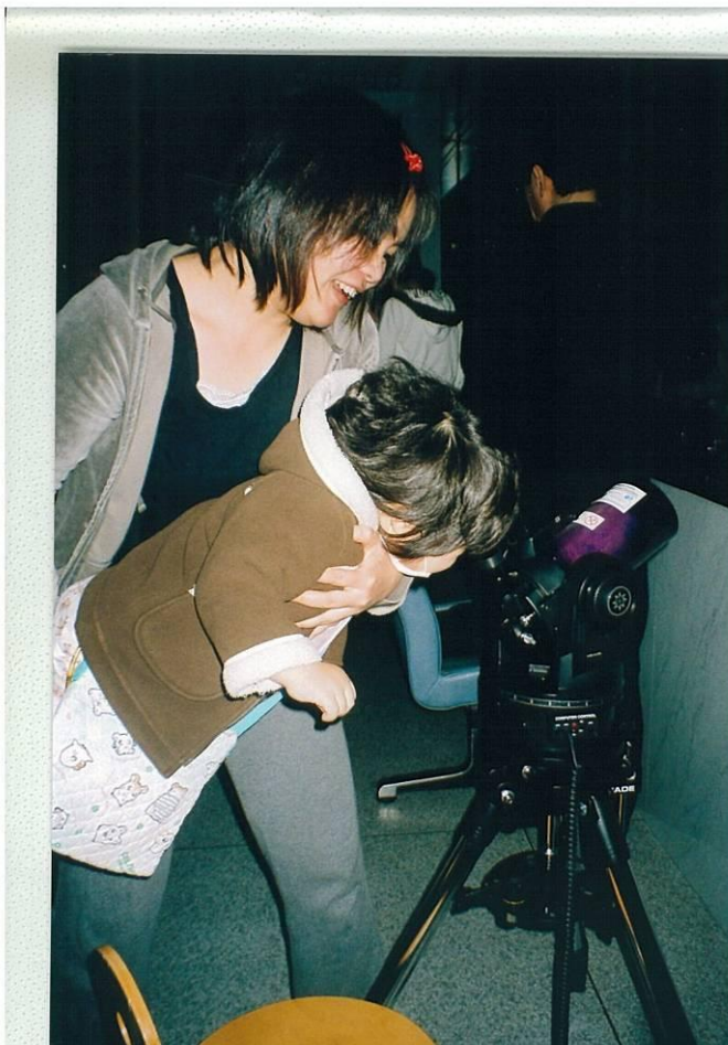
写真3 観望会で望遠鏡をのぞき込む子ども。