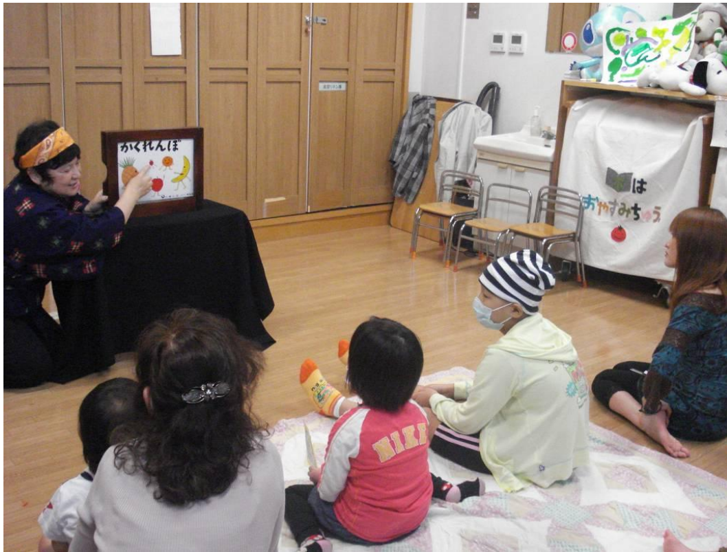
写真4 『かみしばいカチカチ座』による、紙芝居ショー。