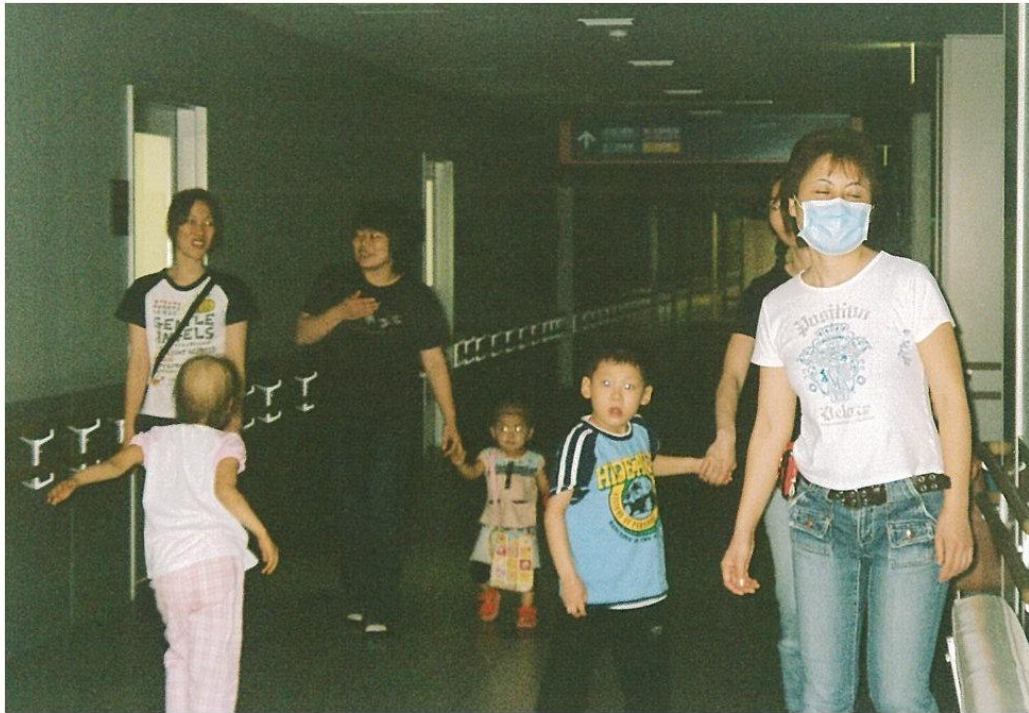
写真2 『黄華堂』の観望会へ参加するため、夜間閉鎖され消灯された廊下を通る子どもたち。