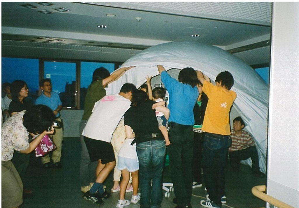
写真1 「宇宙であそぼう『黄華堂』」のプラネタリウム。空気で膨らませたドームの中で上映する。