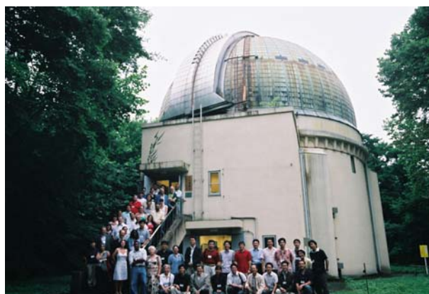
図2：GHOU2007 ようこそ日本へ！

HOUでは、このような活動を紹介する国際会議を毎年行なっています。HOUは国際的な教育活動に広がっているため、Global Hands-On Universeという組織をつくり、情報交換を行っています。今年7月13日～18日まで、国立天文台（東京都三鷹市）と科学技術館（東京都千代田区）をメインの会場にGHOU会議が行なわれました。アジア、アメリカ、ヨーロッパ、中東、アフリカなど各国から約100名の参加がありました。口答発表では大型望遠鏡のネットワーク作りや、各国の実践の紹介、高校生によるポスターセッション、親睦を兼ねてのエクスカッションがありました。JAHOUでは、これまでリードしてきたJupiter projectや、科学技術館を中心に行なっている社会教育での活動の様子の発表を行ないました。