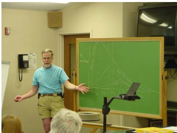
図 3 : ヤーキス天文台台長による講義