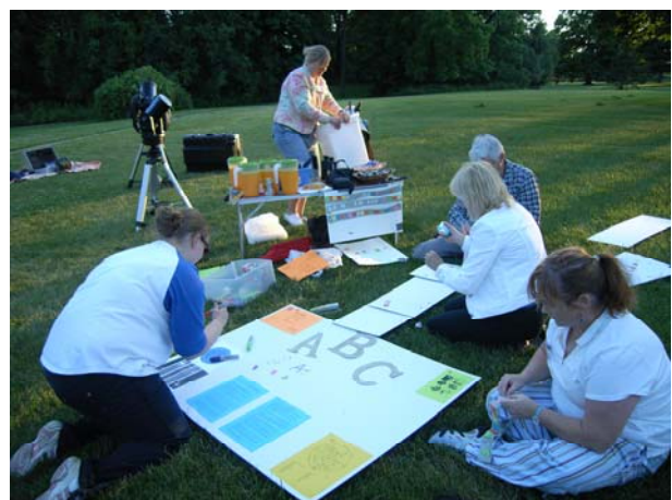
図 4 : 観望会コンペティション 観望会のテーマを決め、説明ボードやゲーム、お土産などを用意しています。