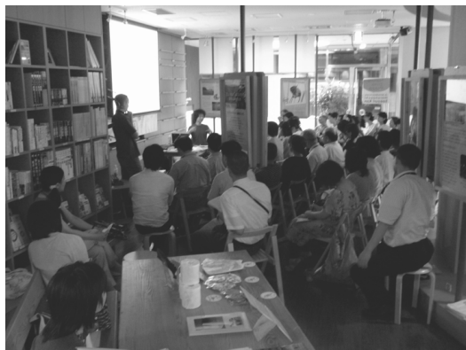
図1 まるのうち宇宙塾の様子 座席は講演形式で配置したが、参加者と講師の物理的距離が近くなるようにしてある。

まるのうち宇宙塾は、天プラが掲げる中課題設定のうち「専門知の構造化」と「知の体系への接続」にまたがる活動である。その中でも、特に「天文分野内の構造化」と「置くアプローチ」という小課題設定に軸足を置いて設計され、実施されたのがまるのうち宇宙塾の活動である。都心部で働く成人を主な対象としており、講師と参加者の対話を中心に据えた組み立てになっている。以下では、まるのうち宇宙塾の概要を紹介する。