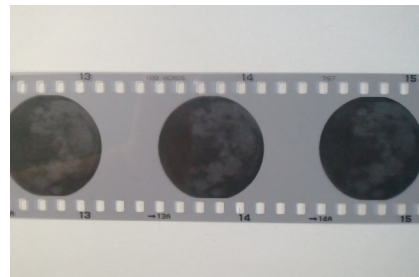
図 1 使用したネガ

現像後、ネガ（図 1）を引伸機で投影し、ものさしを用いて月の南北方向の視直径を測定した。