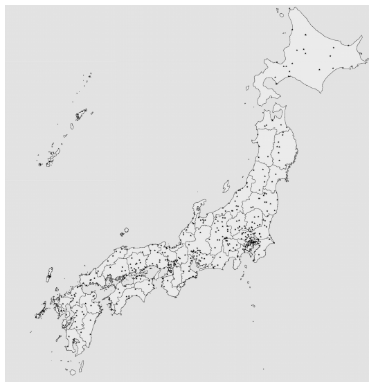
図 1 全国の天文関係施設集計に参加した 473 施設の所在地をプロットした。施設一覧は別に記載する。

連絡員の徹底リサーチにより、全国 533 施設を網羅的にリストアップできた(図 1)。