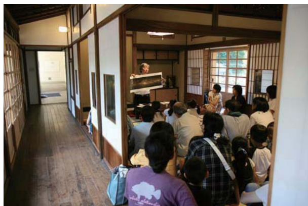
図2 開館記念台長講話

に30名が集まり、観山台長はALMAサイトで撮影された素敵な天の川の写真を見せながら宇宙の謎解きの楽しさを熱く語ってくれました。