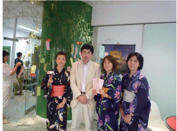
図5 七夕飾りの前で一星に願いをー