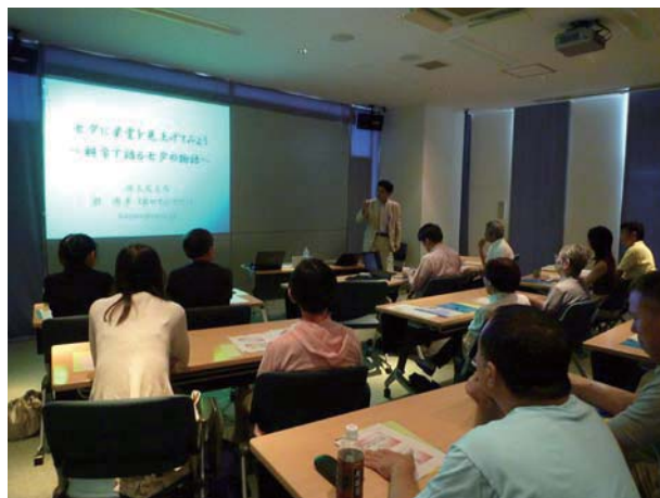
図3 三鷹ネットワーク大学での講演会

それに先立ち、7月5日には、JR三鷹駅南口の三鷹ネットワーク大学[2]を会場に「七夕に星空を見上げてみよう～科学で語る七夕の物語～」と題して、縣が市民向けの講演をいたしました。