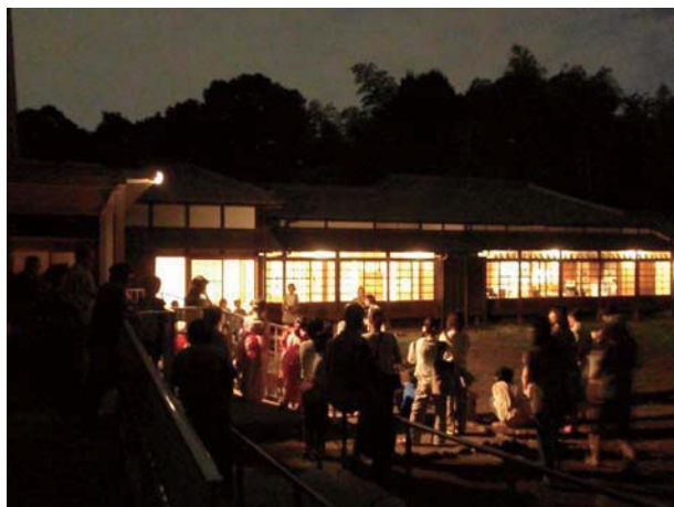
図1 星と森と絵本の家

七夕の日、国立天文台三鷹の構内に「三鷹市 星と森と絵本の家」[1]が開館しました。ここは子どもたちが宇宙や自然に関する絵本に出会う場です。さらに、絵本と台内の自然環境を媒体として子どもたちと親・祖父母世代の市民にも宇宙・自然・科学への知的好奇心を育む場となることを目指しています。