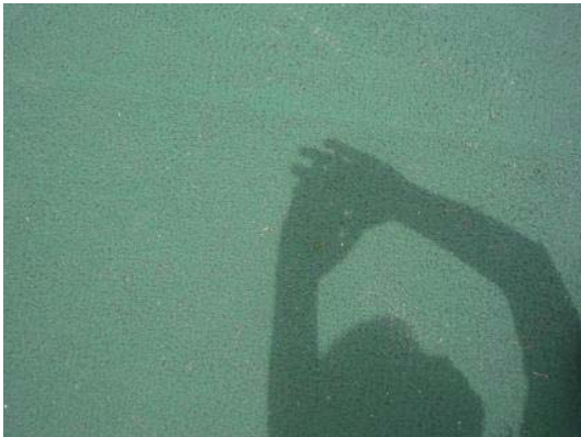
図 5 手を利用してのピンホール投影