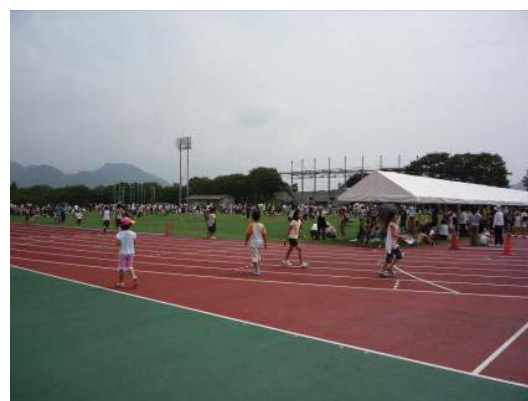
図2 維新百年記念公園 まるで運動会のようなのですが、この暑さにテントは必要。救護所も用意され、看護師さんも2名待機。