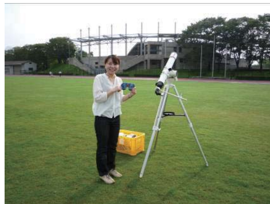
図1 会場準備中の筆者 8cm 屈折望遠鏡を6台設置。

参加者の中には、自作の太陽投影装置を持参する小学生もいましたが、いざ日食が始まるとそっちのけです。自由研究のための情報収集でしょうか? 報道関係者の後ろを記者と一緒にメモを持って回る子供たちも見られます。