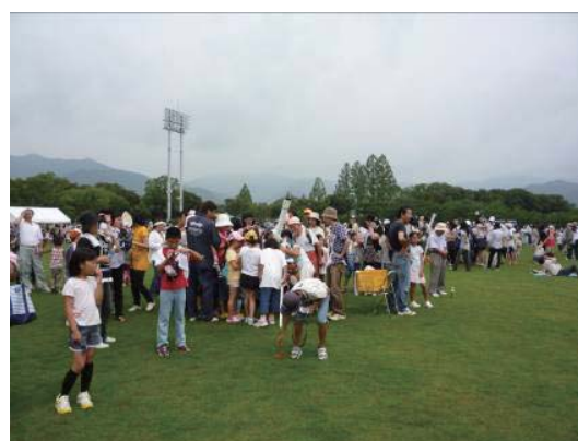
図3 会場の様子 日食グラスは4種類、予備も合わせて600個以上配布。