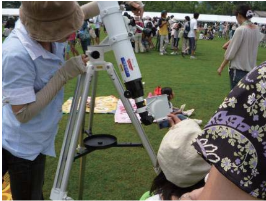
図 4 11 時 9 分 望遠鏡を使用しての投影

博物館職員、ボランティアスタッフ、財団職員を合わせても約 30 名。参加者の対応にぎりぎりの状態で、日食撮影どころではありません。観察用に用意していたピンホールカードやミラーボールもほとんど活躍することなく、慌てて数枚の記録写真を撮るのが精いっぱいでした（図 4、5、6）。