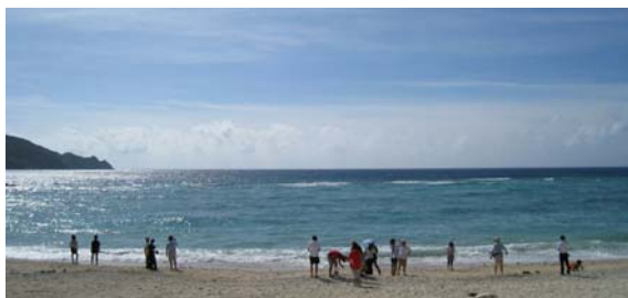
図 7 自然の家近くの貝浜にて

自然の家の中庭に観測機器がずらっと並んだ光景は、なかなかの壮観でした(図 6)。参加したグループは、それぞれが個性的で多様な観測方法を準備していました。望遠鏡の中には太陽観測用の H\alpha 望遠鏡もあちらこちらに見られました。カメラもスチルからビデオまで、そしてレンズも望遠から魚眼まで様々です。電波観測をするためのアンテナも複数台持ち込まれていました。それ以外にも、気温や照度あるいは電離層など気象観測的なテーマに取り組むところや生物の行動観察に取り組むところもありました。