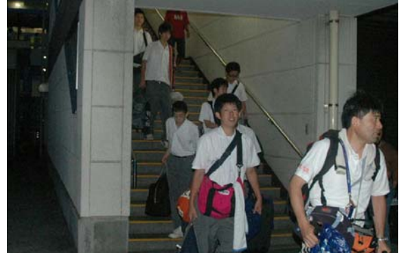
図2 フェリーから下船してきた参加者

体育館で交流会です。これは進行も参加の生徒にやってもらい、現地の大島高校の生徒も参加して、なかなかの盛り上がりとなりました。