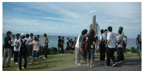
図5 あやまる岬にて