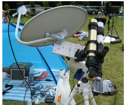
図 10 BS アンテナによる電波観測装置

短径 45cm のオフセット型 BS アンテナを赤道儀に載せ、太陽を追尾しながら電波強度を測定しました（図 10）。