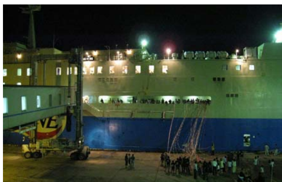
図 12 名瀬港を出るフェリー

観測報告会を終えて、夕食を食べたあとはバスで名瀬港へ、そして再びフェリーに乗り込み、観測会に参加した皆さんは慌ただしく島を去っていきました(図 12)。