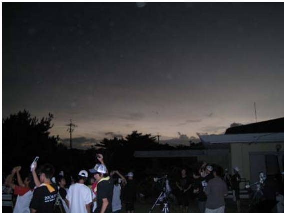
図 9 皆既の時 その 2（東側）

当然ですが、皆既の後も第 4 接触まで観測は続き、その後、片付けに入りました。それと並行して観測結果のまとめにも取り組んでいました。というのは、この日の午後には観測報告会が予定されていたからです。午後の遅めの時間ではありましたが、それでも観測報告をまとめるのは大変な作業で、時間がない中、中学生も高校生も一生懸命に議論したり、資料を作ったりしていました。大島北高校で観測したグループも、思ったほどの渋滞には巻き込まれず、観測報告会には全員が集まることができ、それぞれの成果や観測などを報告していました。中には、クマゼミの鳴