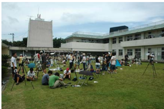
図 6 観測リハーサルの様子

翌 21 日午前には観測リハーサルです。朝の集いの時に、幻日が見えました。虹の断片が太陽の両側に見えて美しかったのですが、振り返ってみると、これはどうやら不吉な前兆だったのかも知れません。その後、薄い雲が時々かかるものの、この日は太陽もはっきり見える中でのリハーサルとなりました。