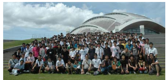
図4 奄美パークでの記念写真