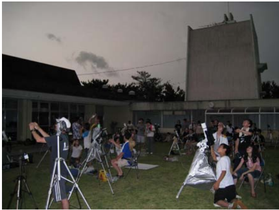
図 8 皆既の時 その 1（南側）