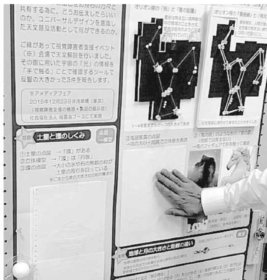
図3 ツールを貼付けた「触るポスター」

また「触ることで理解が促進すること」「配慮する点」は誰にとっても必要で大切なことであり、特別ではないことも実感でき、「ユニバーサルデザイン」という概念への理解が深まった。学びながら活動を育てていきたい。