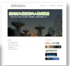
信州佐久星空案内人の会HP