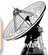
Nobeyama Radio Observatory